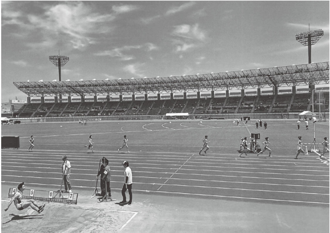
▲ 最優秀賞 『ゴールへ・とべ!』 脇町高校 坂本 梓